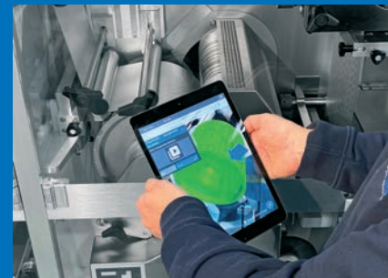
Formatwechsel mit Augmented Reality