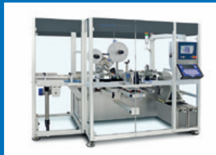
Kombinierbar mit Track & Trace Systemen