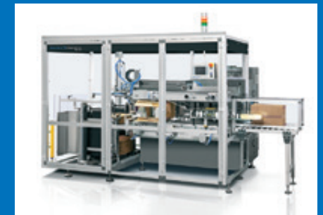
Kombinierbar mit Endverpackungslösungen