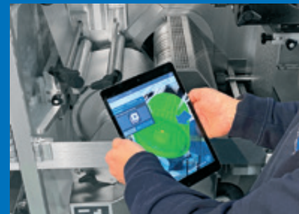
Formatwechsel mit Augmented Reality